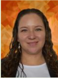
Merly Abril Matemática I E